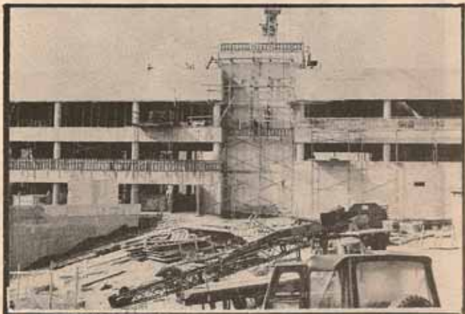
ESTRUCTURA DEL NUEVO HOSPITAL SAN LUCAS, PONCE