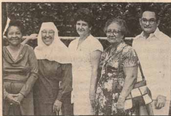
Miembros asociados de la Orden Religiosa Hermanas de la Transfiguración, Ponce, P. R.