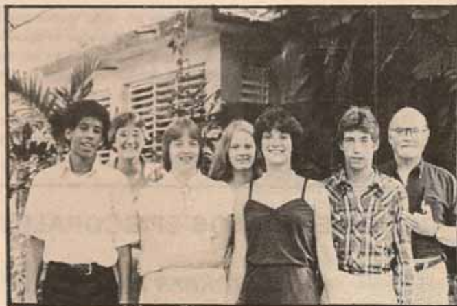
JOVENES DE LA DIOCESIS DE BELEN