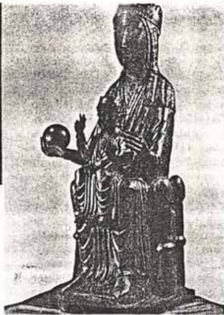
SANTA MARIA de MONSERRATE NUESTRA PATRONA SANTA

La construcción del templo nuevo empezará este Julio, y esperemos celebrar las navidades dentro de sus paredes.