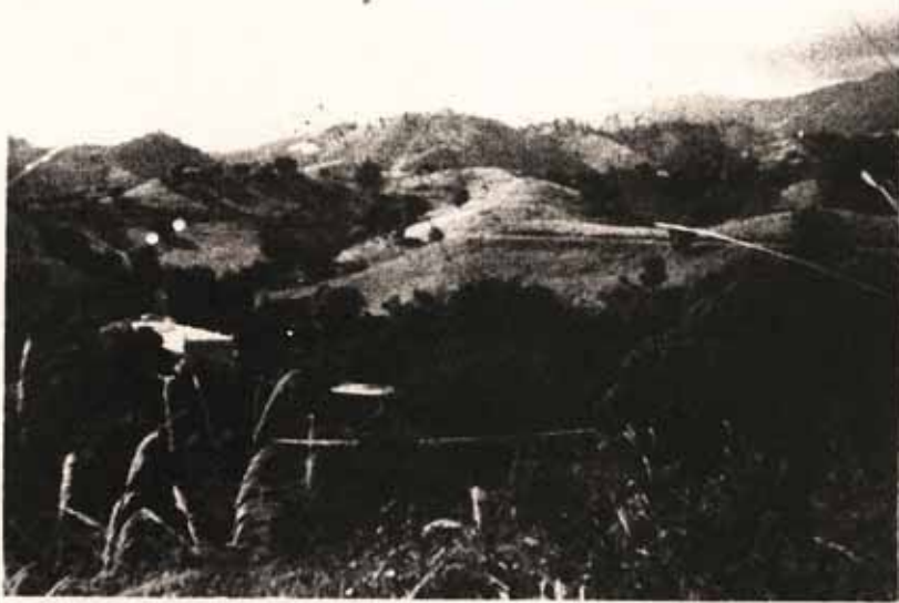
Vista de La Misión